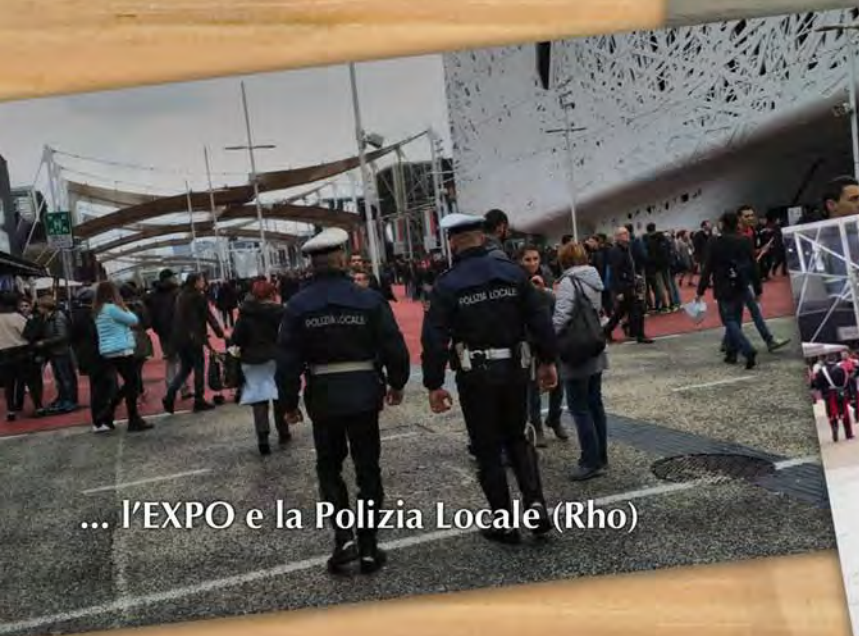
... l'EXPO e la Polizia Locale (Rho)